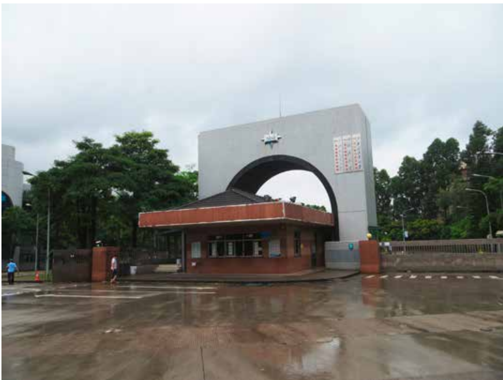
MSI-Fabrik in Shenzhen