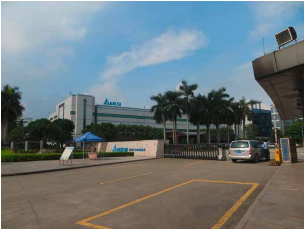
Taida Electronics-Fabrik in Dongguan