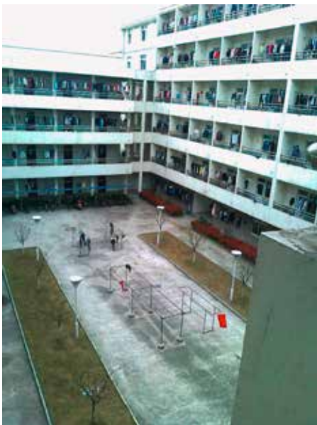
Außenansicht des ArbeiterInnenwohnheims Nr. 9 der Mingshuo-Fabrik