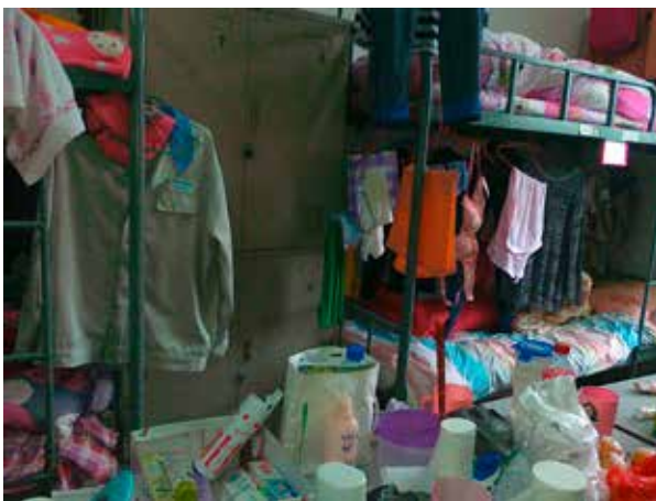
Innenansicht des ArbeiterInnenwohnheims Nr. 9 der Mingshuo-Fabrik

55 ArbeiterInnen müssen sich eine Toilette teilen und 27 ArbeiterInnen müssen sich eine Dusche teilen, was lange Schlangen zur Folge hat. 272 ArbeiterInnen müssen sich eine Münz-Waschmaschine teilen. Bisweilen gibt es Wassermangel und kein heißes Wasser. In der MSI-Fabrik teilen sich zehn ArbeiterInnen einen 30m 2 großen Raum und eine kleine schmutzige Toilette. Die schlechten und beengten Verhältnisse lassen den BewohnerInnen kaum Privatsphäre; alltägliche Notwendigkeiten wie das Waschen und Trocknen von Kleidung, die persönliche Hygiene und ähnliches werden dadurch kompliziert und zeitaufwändig. 45