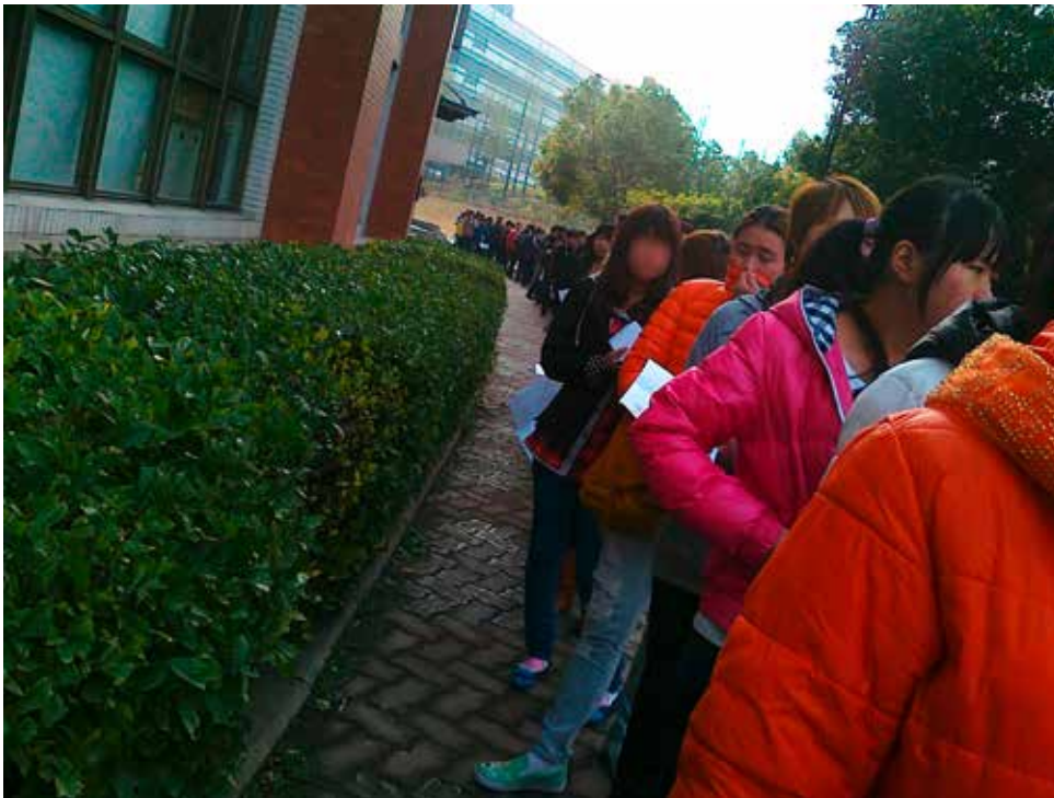
Warteschlange neuer Mitarbeiter der Mingshuo-Fabrik in Suzhou

Die amerikanische Computerfirma Dell wurde 1984 von Michael Dell gegründet. Sie ist eines der größten Technologie produzierenden Unternehmen der Welt und ein wichtiger Akteur am privaten und öffentlichen PC Markt in Europa. Dell liegt in punkto Verkaufszahlen weltweit 64 auf Platz drei und in Europa 65 auf Platz vier. Dell hält die Führungsposition auf dem weltweiten PC Bildschirm-Markt. 66 1998 eröffnete das Unternehmen sein erstes Werk in China und steigerte seit damals seine Präsenz im Land sowohl in punkto Produktions- als auch Verkaufszahlen. Dell ist Alleineigentümer von 25 Tochterunternehmen in China 67 und einer unbekanntenen Anzahl zweitrangiger Zulieferer, wobei das Unternehmen nunmehr der größte Computeranbieter auf dem chinesischen Markt ist. 68 Michael Dell verkündete im Juni 2013: „Unser Engagement in China war niemals stärker, und die fortdauernden Investitionen zeigen abermals die Wichtigkeit Chinas für die Strategie und die Zukunft von Dell.“ 69 Mit einer jüngsten Expansion in die chinesische Binnenstadt Chengdu scheint Dell sich weg zu bewegen von den Küstengebieten, hin zu Gegenden mit niedrigerem Mindestlohniveau. 70