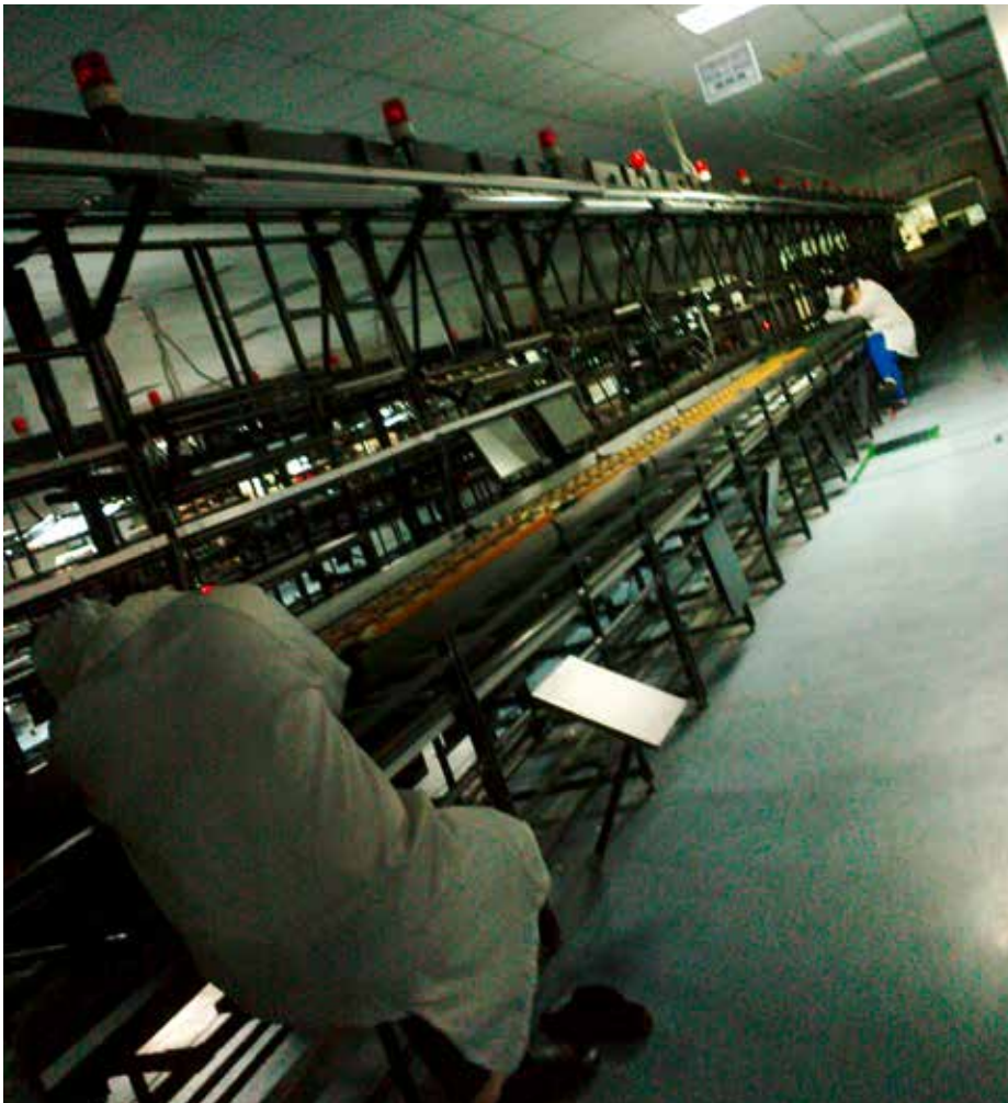
ArbeiterInnen bei einer kurzen Pause während der Nachtschicht

Raue Arbeitsbedingungen und Verstöße gegen mehrere chinesische Arbeitsgesetze, internationale Arbeitskonventionen und Menschenrechte wurden im Zuge der Untersuchungen gegen die vier Dell-Zulieferer in den Provinzen Guangdong und Jiangsu festgestellt. 5 Aufgrund von Altersgrenzen, die von Arbeitsagenturen und auch bei der direkten Anstellung durch die Fabriken angewendet werden, sind die ArbeiterInnen zwischen 16 und 36 Jahren alt. Sie legen oft große Distanzen zurück um eine Anstellung zu finden. Doch sobald sie einmal angefangen haben in den Fabriken zu arbeiten und in überfüllten Wohnheimen zu leben, sind nur wenige mit ihrer Situation zufrieden. Die Mehrheit der außerhalb des Fabrikgeländes befragten ArbeiterInnen gaben an, schon im Laufe des kommenden halben Jahres kündigen zu wollen – aufgrund der schlechten Löhne, des Arbeitsdrucks, der langen Arbeitszeiten und jeglichen Fehlens einer Aussicht auf Beförderung. 6