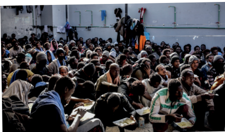
Lager der Schande - Europas Libyen-Deal ©

Der Dokumentarfilm untersucht die Haftlager für Migrantinnen und Migranten in Libyen, wo Tausende unter unmenschlichen Bedingungen darauf warten, dass Milizen, die EU und die UNO über ihr Schicksal entscheiden. Offiziell von der libyschen Regierung verwaltet, haben jedoch die kontrollierenden Milizen das Sagen und nutzen die Geflüchteten als Geldquelle. Der Film beleuchtet die Menschenrechtsverletzungen, denen die Betroffenen ausgesetzt sind, und zeigt Videos von Betroffenen, die wertvolle Einblicke in ihren Alltag in den Lagern geben. Viele waren gezwungen, während des Bürgerkriegs an der Seite der Milizen zu kämpfen, und einige waren sogar in bombardierten Gebieten gefangen. Die europäische Politik zielt darauf ab, die Außengrenzen zu schützen, indem sie libysche Behörden unterstützt und so indirekt ein menschenunwürdiges System begünstigt.