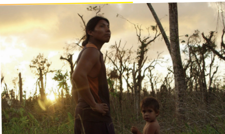
Patrullaje - Camilo de Castro ©

Das biologische Reservat Indio-Maíz an der Karibikküste Nicaraguas ist heiliger Boden für das Volk der Rama und der afro-abstammenden Kriol, die es seit Generationen ihr Zuhause nennen. Da die weltweite Nachfrage nach Rindfleisch steigt, ist diese reiche, artenreiche Umwelt ernsthaft von illegalen Viehzüchtern bedroht, die Flächen stehlen und große Teile des Regenwaldes abholzen, um ihre Herden weiden zu lassen. Bei dem derzeitigen Tempo der Dezimierung könnte das Reservat in weniger als fünf Jahren ausgelöscht sein. In dem Versuch, ihr angestammtes Land zu schützen und einen der letzten verbliebenen Regenwälder in Mittelamerika zu erhalten, schließen sich indigene Ranger mit einem amerikanischen Naturschützer und Undercover-Journalisten zusammen, um die dunkle Welt des Konfliktrindfleischs zu enthüllen.