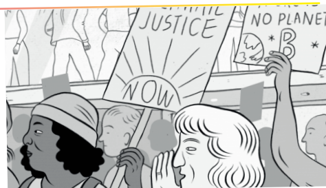
Der laute Frühling

Ihr Film verbindet die Proteste von Arbeitnehmer:innen mit denen der Klimaschutzbewegung, was sowohl Möglichkeiten als auch Grenzen aufzeigt.