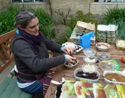
Terra Viva-Mitglieder stellen Saatbomben her, um Bienen und Schmetterlinge anzulocken