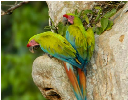
Eque latusae velenis aliquiscipsa poris