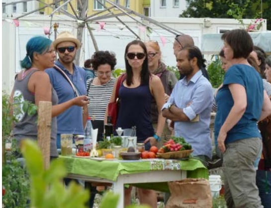
Interessierte beim Sommerfest 2015 am Terra-Viva-Stand