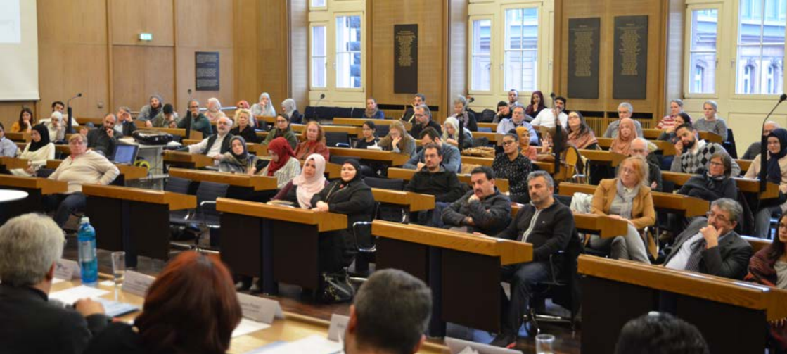
Treffen des Landesausländerbeirats