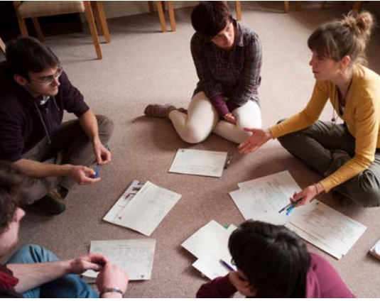
gewaltfrei handeln e.V.: Eine Kleingruppenarbeit im Rahmen einer Fortbildung