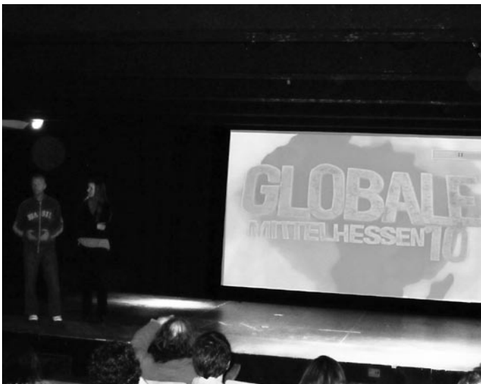
Auf dem Dokumentarfilmfestival „Globale Mittelhessen 2010“

Auch zukünftig ist die Geschäftsstelle gerne bereit, Treffen zu organisieren und nach ihren Kräften einen intensiveren Austausch zu ermöglichen.